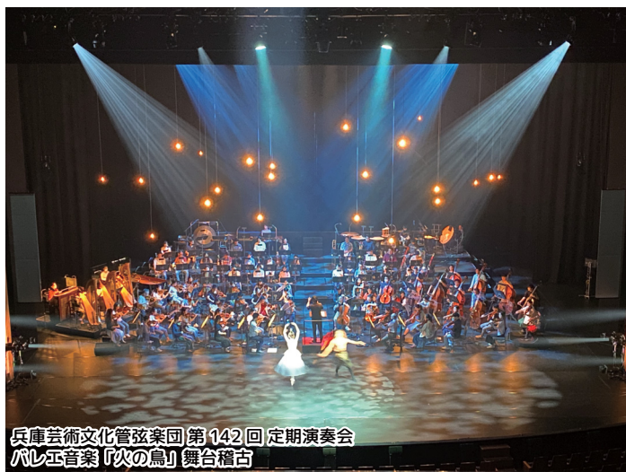
兵庫芸術文化管弦楽団 第142回 定期演奏会 バレエ音楽『火の鳥』舞台稽古

50本ものスピーカーで構成されたオーケストラピット内を自由に歩き回ってオペラの演奏を各楽器の音を楽しんでください。